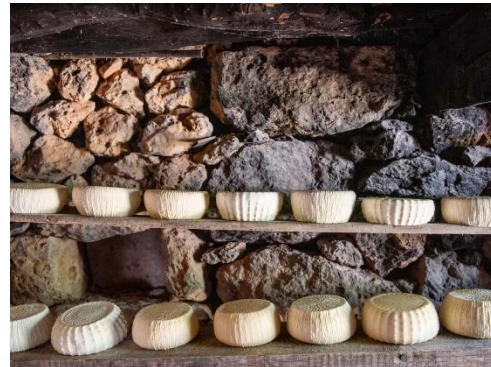
A l'intérieur d'une mitato