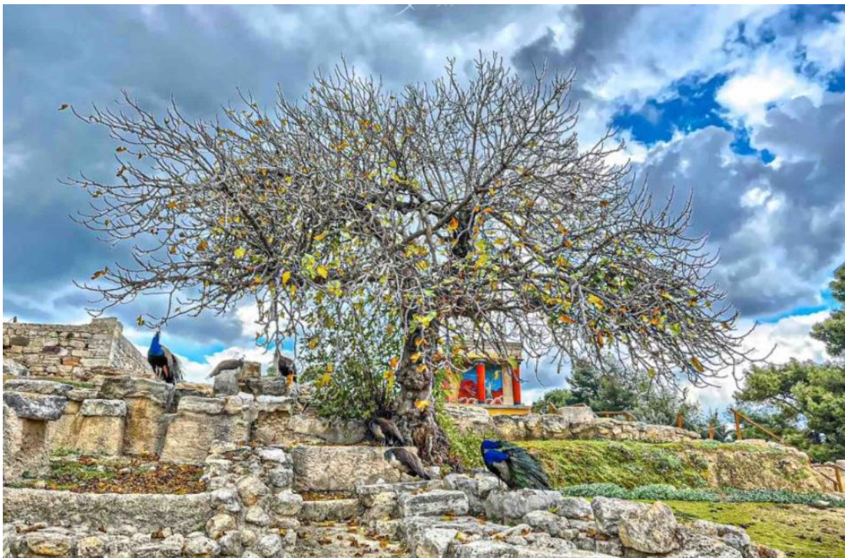
Musée archéologique d'Héraklion au loin

Se munir de sa carte européenne d'assurance maladie (CEAM).