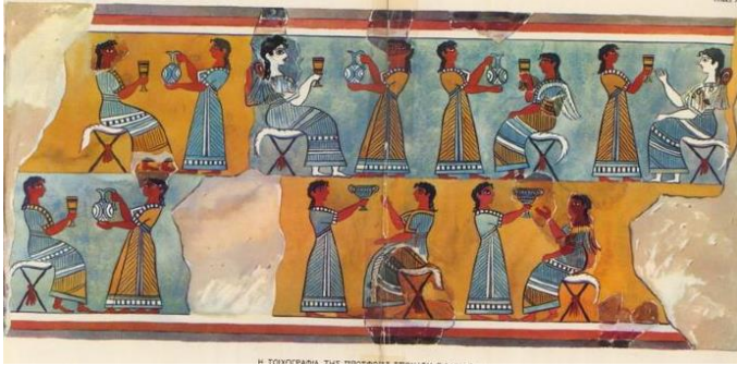
Fresque du musée archéologique d'Héraklion