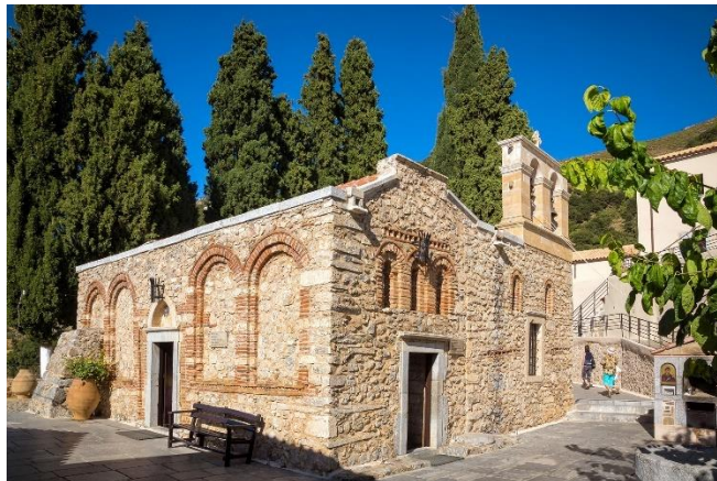
Monastère de Kardiotissa