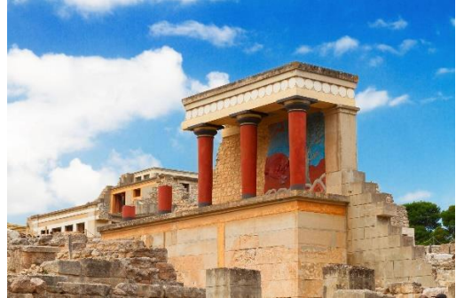
Site archéologique de Knossos