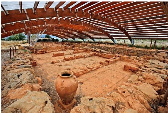
Site archéologique de Malia