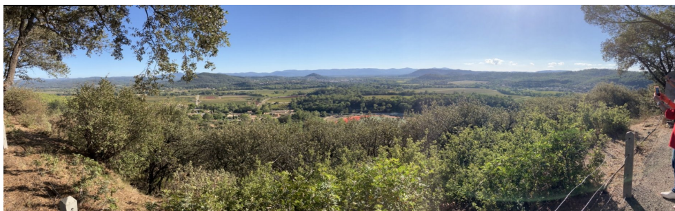
Vue depuis le pied de la tour de Taradeau

salle « Marie Mauron », médiathèque « Jacques Duhamel », rue Robert Schuman, 83110 Sanary-sur-Mer.