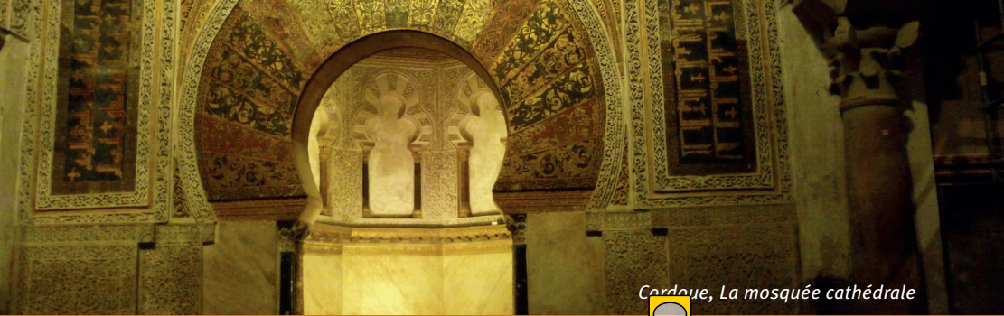
Cordoue, La mosquée cathédrale