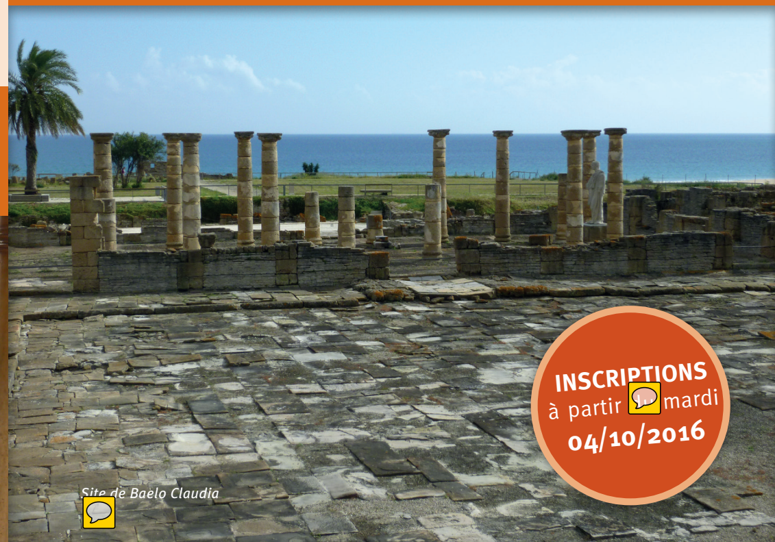
Site de Baelo Claudia